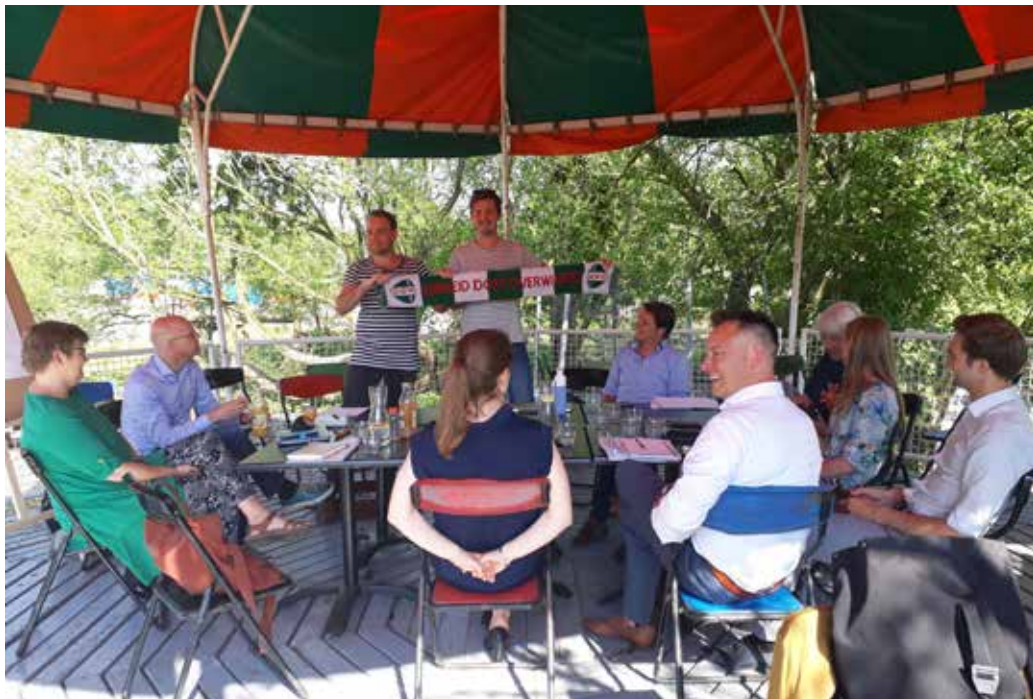
'Laat studenten en Overvechtters samen voetballen op sportpark Vechtzoom'