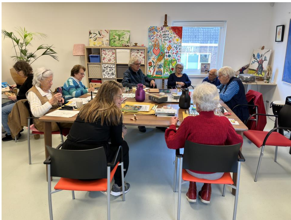
Het project Kunstbeleving heeft zijn vervolg in 2026 met een keur aan nieuwe thema's.

Elke bijeenkomst heeft een ander karakter: beleven, delen, creëren en als 4 e een open programma. De invulling daarvan ontstaat in de weken ervoor.